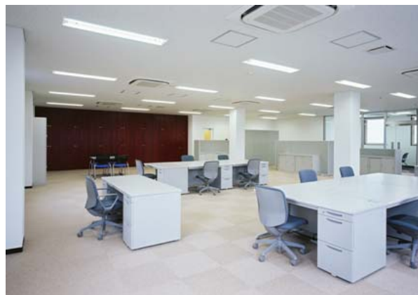
－ 2階 執務室 －

*Low-Eガラス：低放射ガラス。熱の放射を妨げる金属膜が表面にコーティングされたガラス。